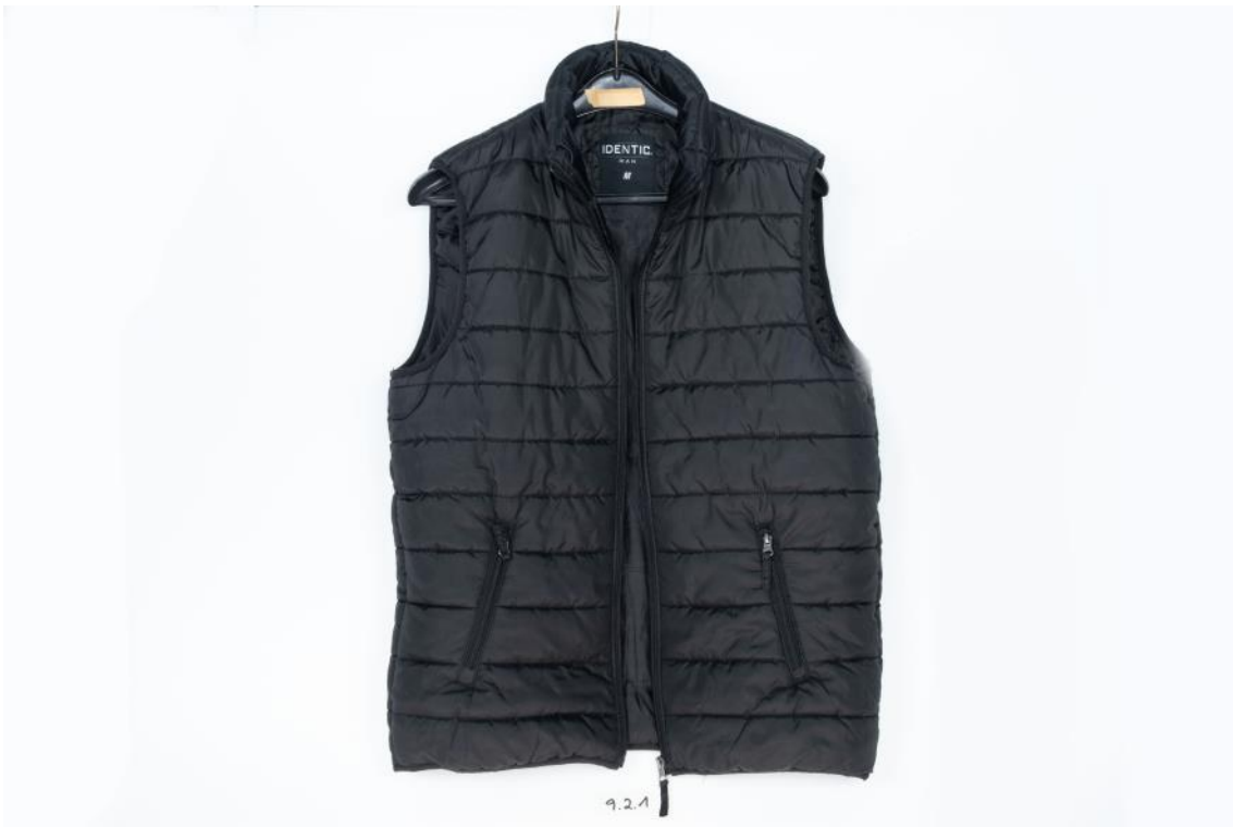
Asservat Nr. 9.2.1