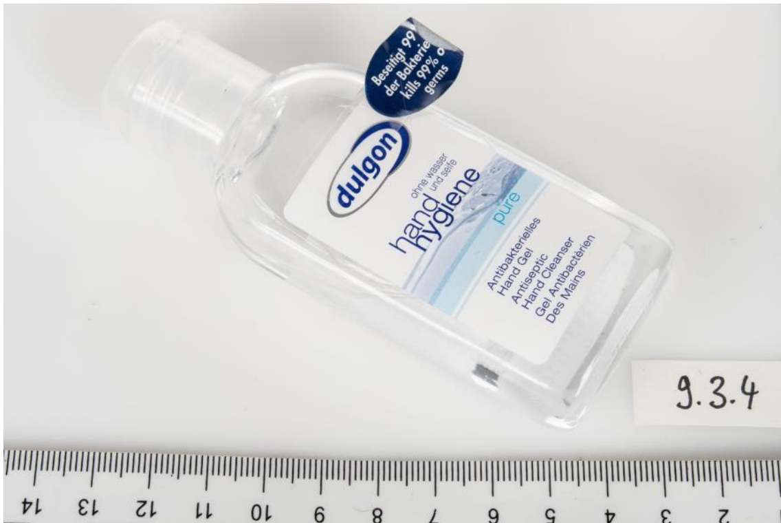
Asservat Nr. 9.3.4