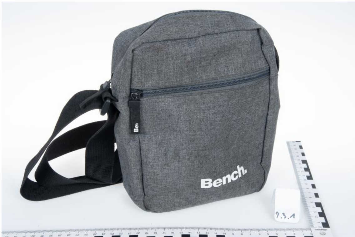
Asservat Nr. 9.3.1