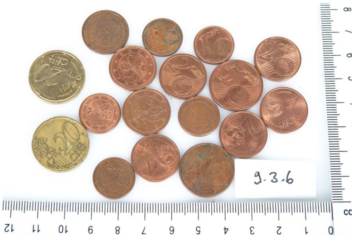
Asservat Nr. 9.3.6