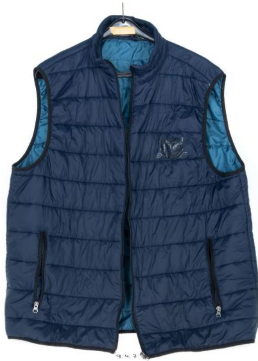
Asservat Nr. 9.4.7