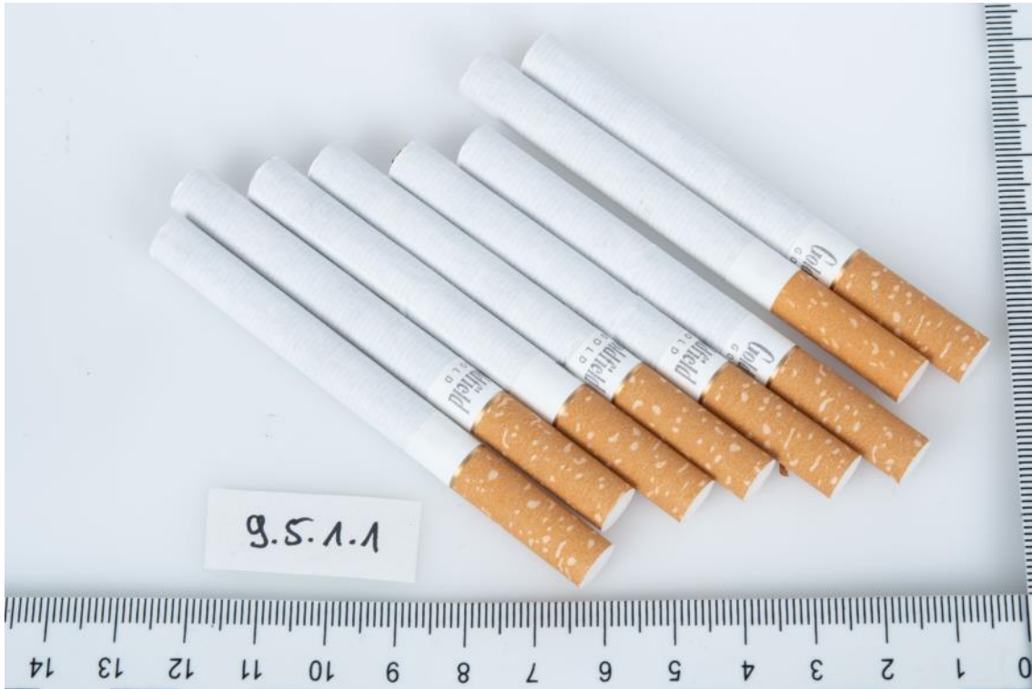
Asservat Nr. 9.5.1.1