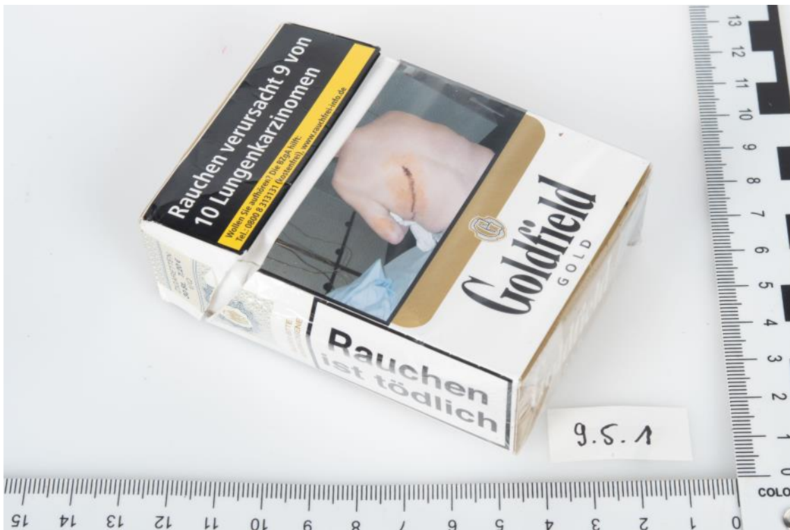
Asservat Nr. 9.5.1