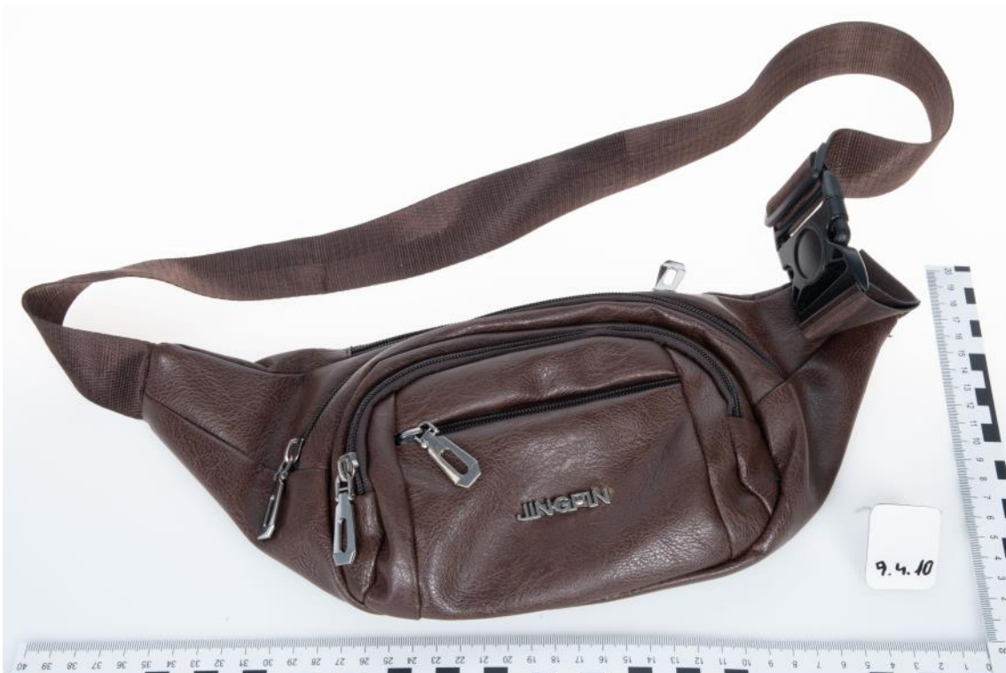
Asservat Nr. 9.4.10