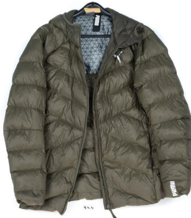
Asservat Nr. 9.4.4