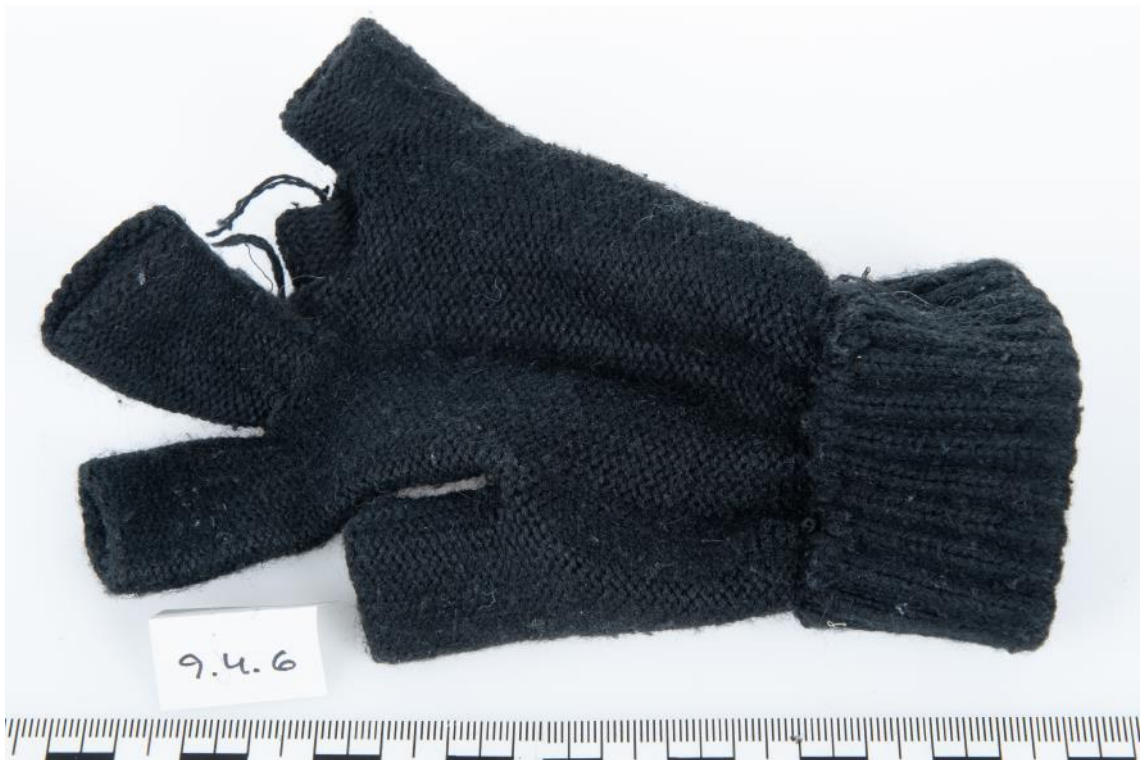
Asservat Nr. 9.4.6