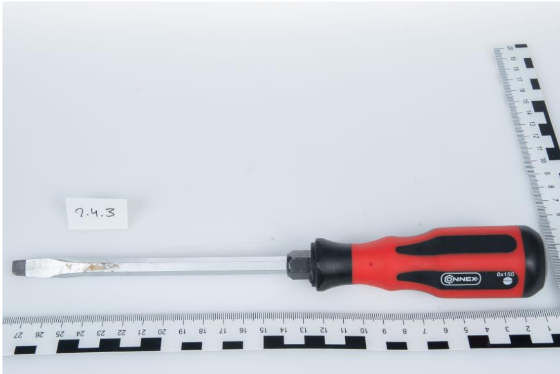
Asservat Nr. 9.4.3