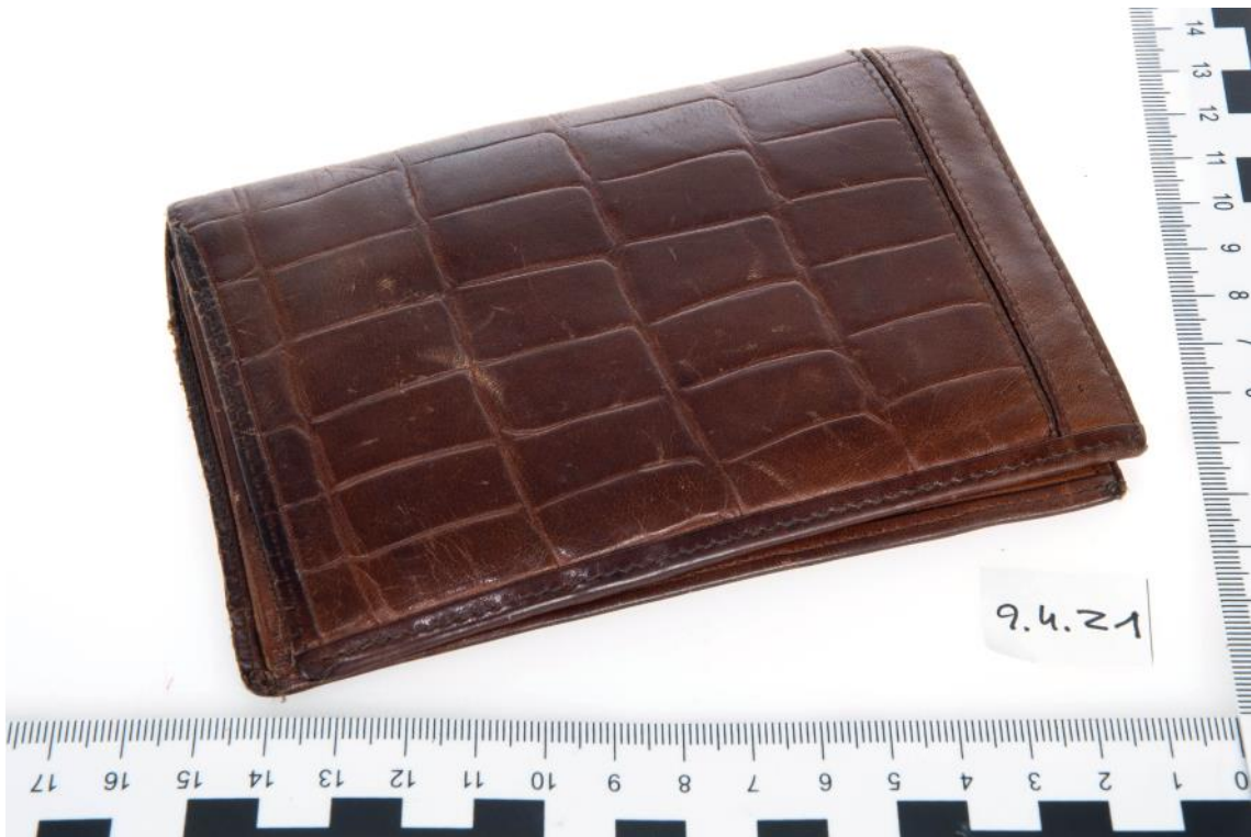
Asservat Nr. 9.4.21