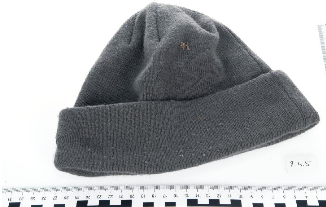
Asservat Nr. 9.4.5