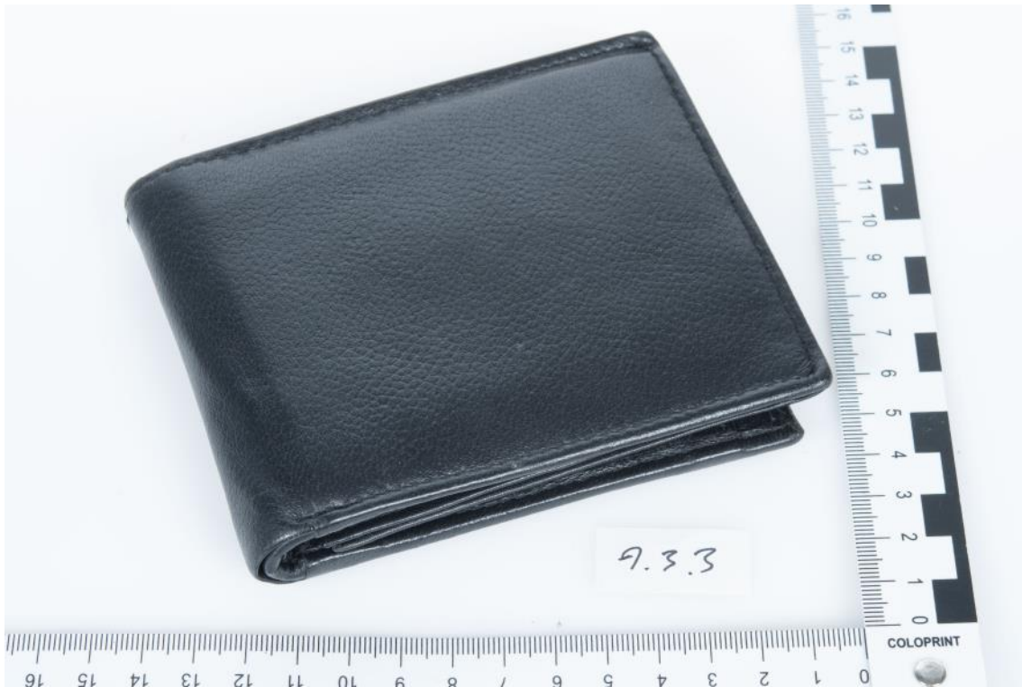
Asservat Nr. 9.3.3