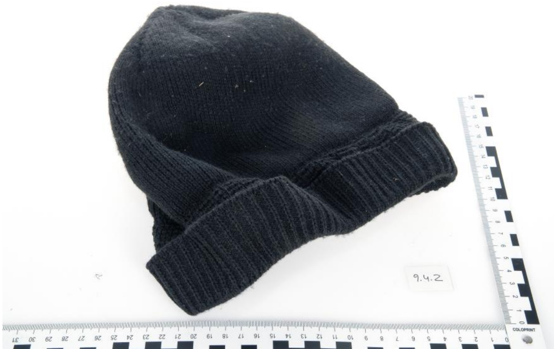
Asservat Nr. 9.4.2