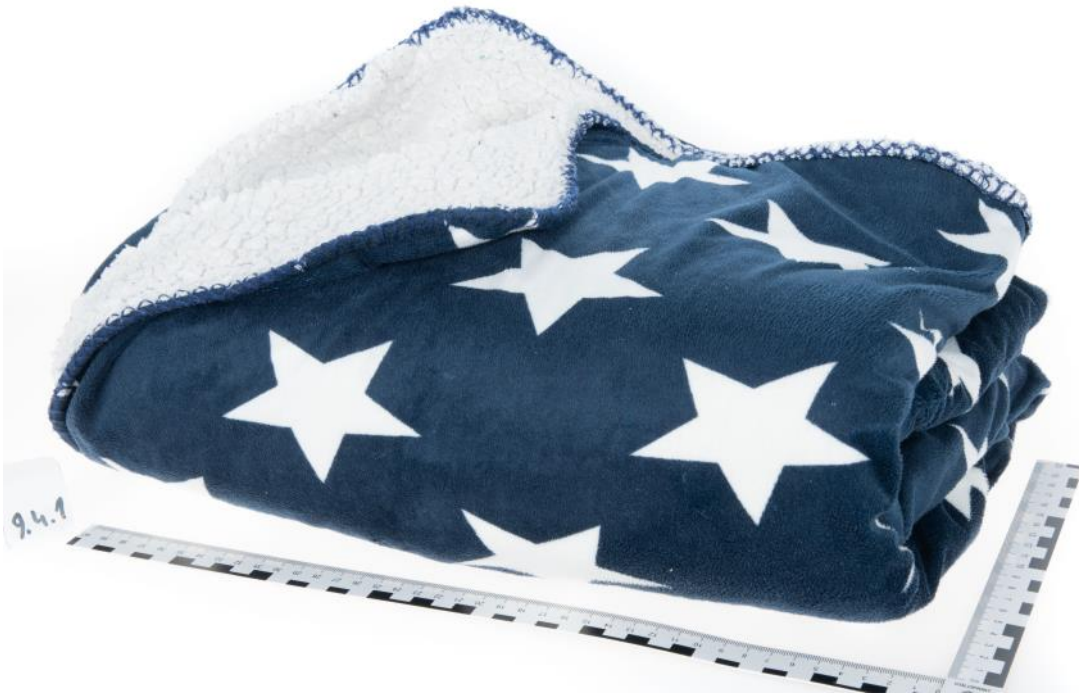
Asservat Nr. 9.4.1