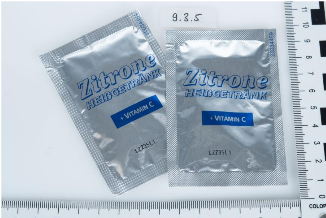
Asservat Nr. 9.3.5